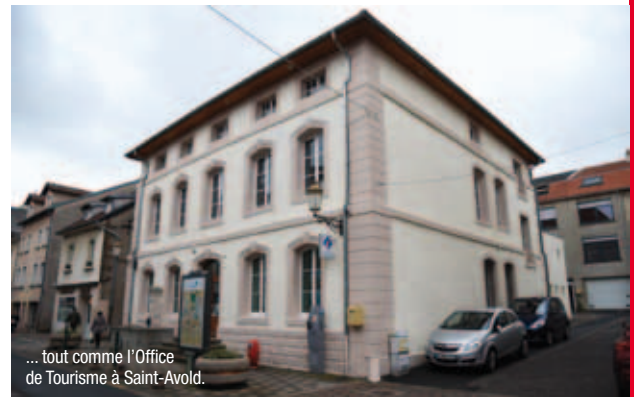
... tout comme l'Office de Tourisme à Saint-Avold.