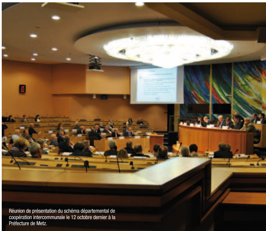
Réunion de présentation du schéma départemental de coopération intercommunale le 12 octobre dernier à la Préfecture de Metz.

Le 12 octobre 2015, Nacer Meddah, alors préfet de la Moselle, présentait les propositions du futur schéma départemental de coopération intercommunale. En précisant notamment que « l'État n'[était] pas là pour se substituer aux élus car [ils] sont l'expression du suffrage. C'est aux élus de voir si on peut aller plus loin, tout ça, dans le cadre de la loi. Cependant, nous devons tous avoir la plus forte ambition pour la Moselle ». Des propositions qui ont pour vocation d'accorder davantage de capacités aux petites intercommunalités. En effet, la Loi NOTRe qui prévoit le relèvement du seuil d'intercommunalité de 5 000 à 15 000 habitants, s'accompagne notamment d'un mouvement de renforcement des compétences des intercommunalités. La fusion envisagée entre la communauté de communes du Pays Naborien (environ 42 000 habitants) et la communauté de communes du Centre Mosellan (un peu moins de 15 000) devrait transformer leur statut respectif en ne formant à terme plus qu'une seule collectivité, de sorte à devenir une communauté d'agglomération le 1 er janvier 2017. Soit une étape supplémentaire par rapport à leur