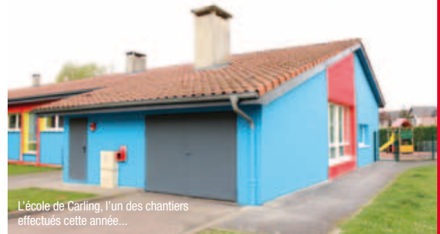
L'école de Carling, l'un des chantiers effectués cette année...

** École Lamartine, Centre Marcel Martin et transformateurs ERDF (Folschviller), Gare SNCF (Valmont), gymnase Crusem et centre équestre (Saint-Avold), presbytère (L'Hôpital) et école (Carling).